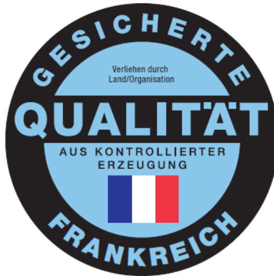
Qualitätszeichen am Beispiel Frankreich