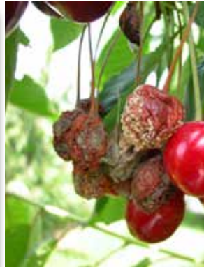
Fruchtfäule ( Monilia ), Pilzerkrankung