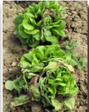
Schwarzfäule ( Rhizoctonia ), Pilzerkrankung