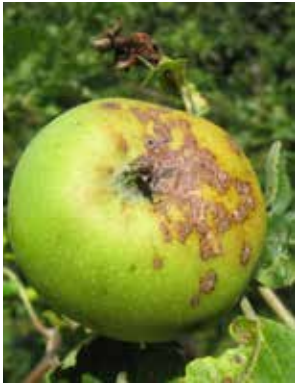
Apfelschorf ( Venturia ), Pilzerkrankung