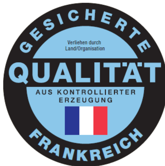
Qualitätszeichen am Beispiel Frankreich